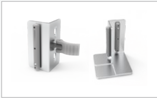
Kit de conector 90° interno direito (FF-90RIC)