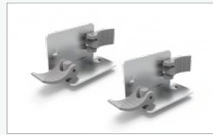
Kit conector central 90° (FF-90MC)