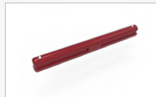
Kit conector de 4 vias (FF-4WC)