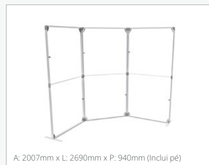
A: 2007mm x L: 2690mm x P: 940mm (Inclui pé)