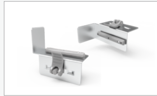
Kit conector arco (FF-ACC)