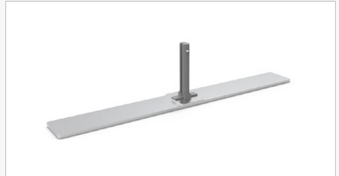
Pé central completo (unidade) FF-MFF