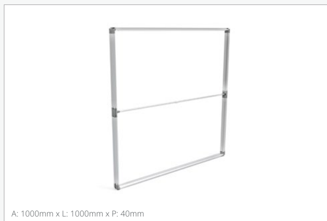
A: 1000mm x L: 1000mm x P: 40mm

FASTFRAME™ FF-50X100-SG (Reimpressão - Standard) FASTFRAME™ FF-50X100-PG (Reimpressão - Premium)