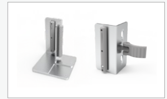
Kit de conector 90° interno esquerdo (FF-90LIC)