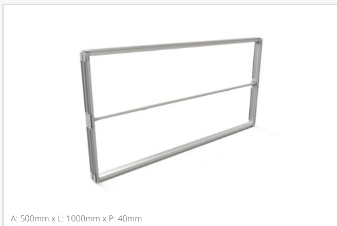
A: 500mm x L: 1000mm x P: 40mm