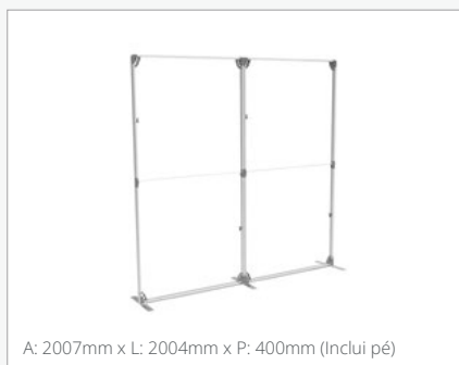
A: 2007mm x L: 2004mm x P: 400mm (Inclui pé)