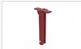
Kit conector de 2 vias (FF-2WC)