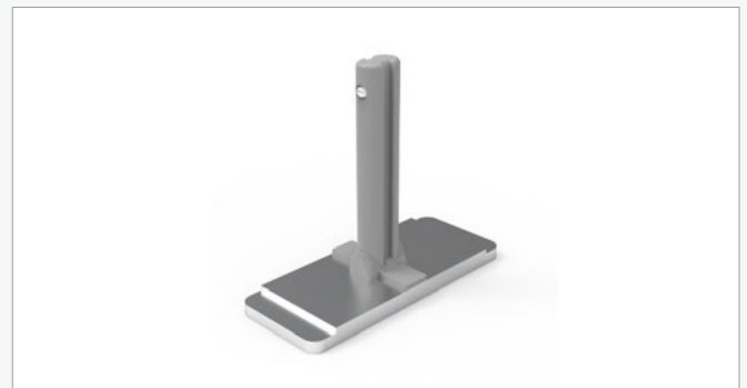
Pé central pequeno (unidade) FF-SMF