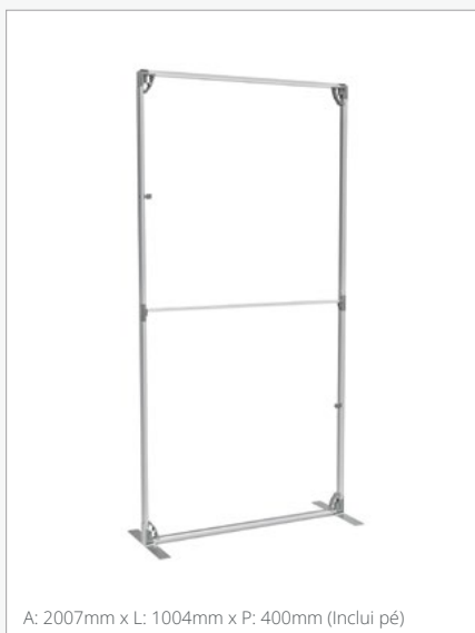
A: 2007mm x L: 1004mm x P: 400mm (Inclui pé)

Inclui x2 1000mm x 1000mm um gráfico e 2 molduras