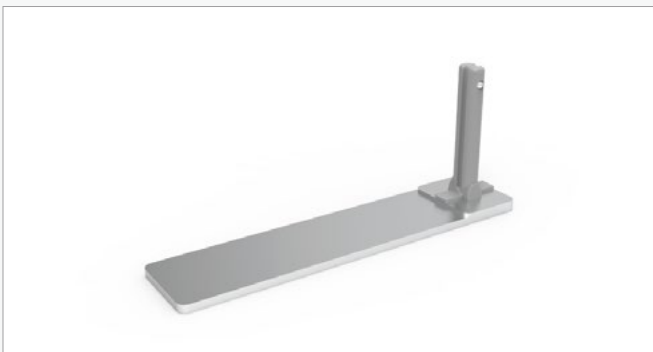
Pie central medio (unidad) FF-HFM