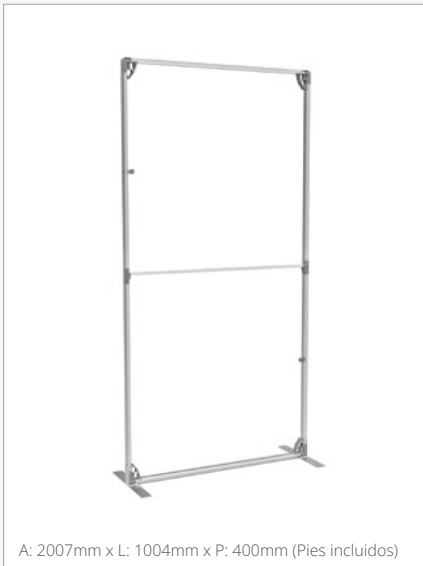
A: 2007mm x L: 1004mm x P: 400mm (Pies incluidos)

Incluye x2 500mm x 1000mm marcos y x2 500mm x 1000mm gráficas