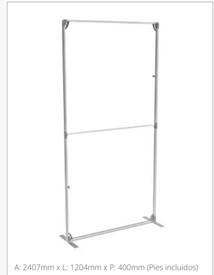
A: 2407mm x L: 1204mm x P: 400mm (Pies incluidos)

FASTFRAME™ FF-100X200-SG (Gráfica Estándar)