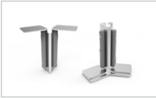
Kit conector de marcos con ángulo 45° (FF-45C)