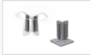
Kit conector de marcos con ángulo 90° (FF-90C)