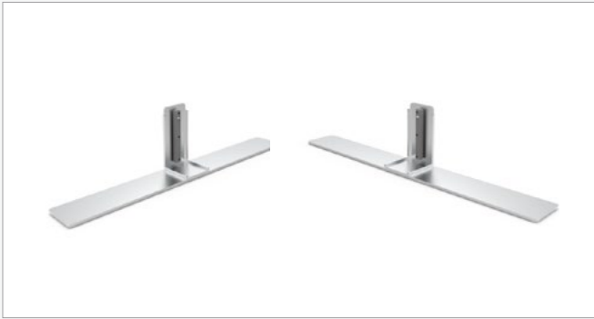
Pie completo (par) FF-FF