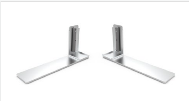
Medio pie (par) FF-SHF