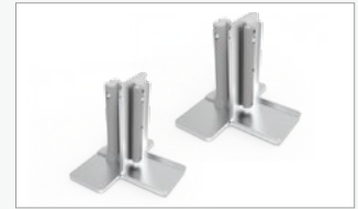
Kit conector con forma de T (FF-TC)