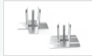
Kit conector en cruz (FF-CC)