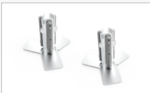
Kit conector con forma de Y (FF-YC)