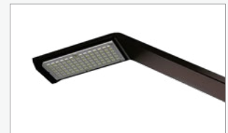
Luz LED para exhibición (LED-EXHIB-ARM-BDLK)